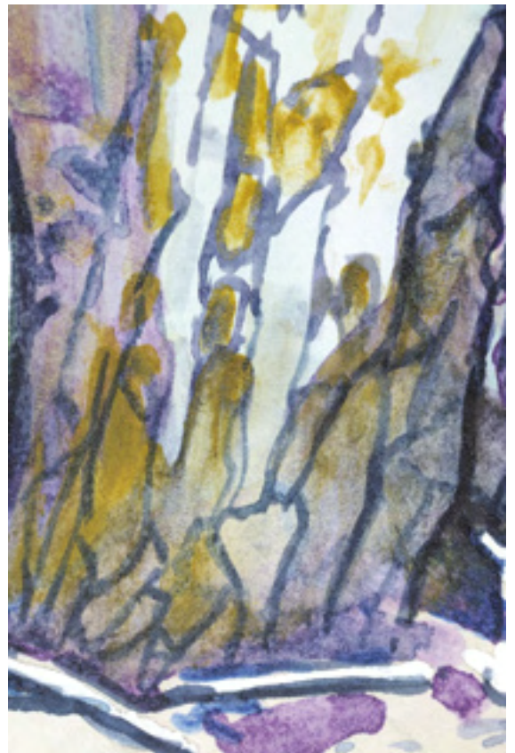
Mit Texturmalmittel die Baumrinde hervorheben und plastischer machen.