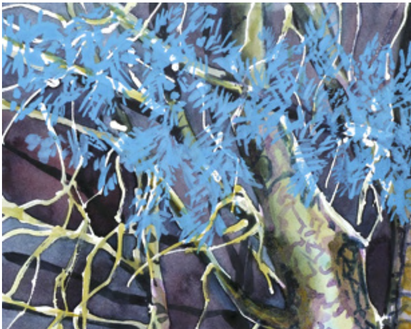
Gouache für leuchtende und deckende Farbaufträge verwenden.